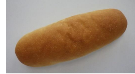
米粉仙台みそパン (30g, 40g, 50g, 60g, 70g)

6月～7月18日期間限定供給品です。「仙台みそ」を配合した新たな製品です。※包装資材にオレンジ色のラインが入ります。(熊谷製パン製造)