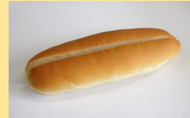
●背割コッペパン (コッペパン, 減塩ソフトパンのみ対応)