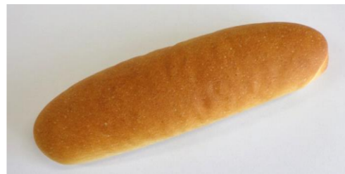
米粉きな粉パン (30g, 40g, 50g, 60g, 70g)

シンプルな味で、和・洋・中さまざまな料理に向いています。(平たく成形するため、形状にばらつきがでる場合があります)