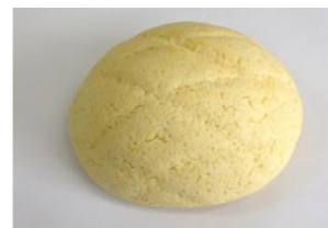
◆メロンパン (30g, 40g, 50g, 60g) お楽しみ献立に最適