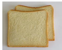
◆豆乳食パン 豆乳と大豆粉を使用した食パン ※包装資材にオレンジ色のラインが入ります。(熊谷製パン製造)