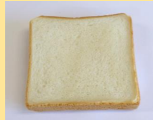
●厚切食パン 50g, 60g, 70g, 80gの1枚