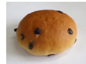
◆チョコレートパン チップチョコ 20%配合