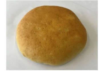
米粉ずんだパン (30g, 40g, 50g, 60g, 70g)

6月～7月18日期間限定供給品です。「仙台みそ」を配合した新たな製品です。※包装資材にオレンジ色のラインが入ります。(熊谷製パン製造)