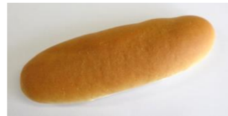
◆減塩ソフトパン 塩分を抑えたパン ※包装資材に白色のラインが入ります。(熊谷製パン製造)