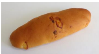
◆チーズパン 角切チーズ 30%配合