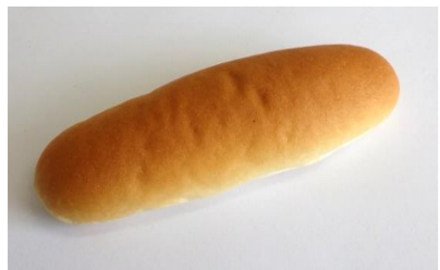
米粉パン (30g, 40g, 50g, 60g, 70g)