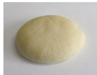
米粉フォカッチャ (30g, 40g, 50g, 60g, 70g)

シンプルな味で、和・洋・中さまざまな料理に向いています。(平たく成形するため、形状にばらつきがでる場合があります)