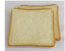
◆ファイバーブレッド イヌリア(食物繊維) 5%配合 ※包装資材に白色のラインが入ります。(熊谷製パン製造)