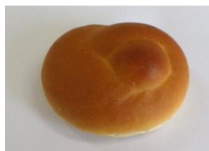
◆ミルクパン 牛乳 30%配合