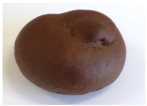
◆ココアパン ココア風味のパン