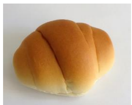
◆バターロールパン 無塩バター 8%配合