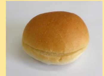
●横割丸パン (丸パンのみ対応)