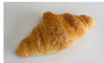
◆クロワッサン (20g, 30g) 行事食献立等に好評