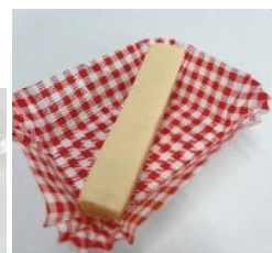
①、②宮城県産米粉（調理用） ③宮城県産米粉ワントン（2×4cm） ④冷凍宮城県産米粉バトンケーキ